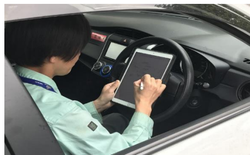
専用モバイル端末を活用し、現場で作業日報報告や作図作成等を行っています。